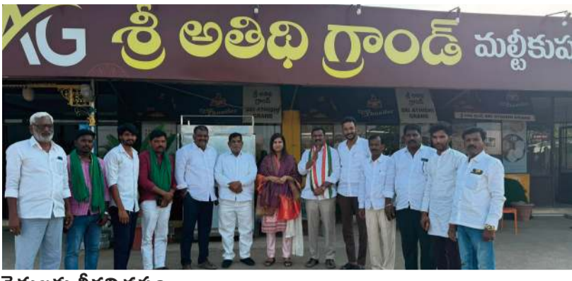
రైతులకు తీరని నష్టం