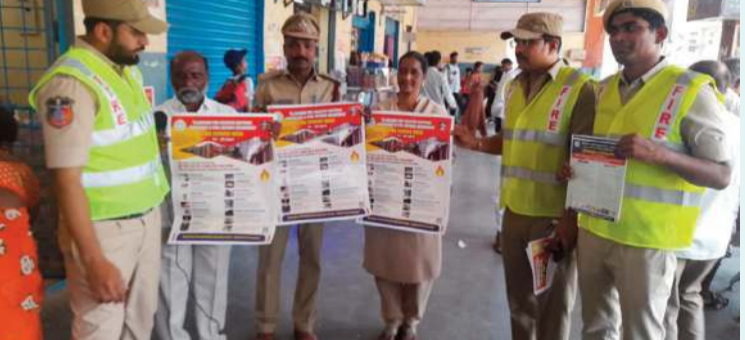
సదాశివపేట, ఏప్రిల్ 15 (నవజ్యోతి ప్రతినిధి) :